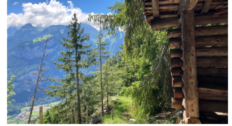
Markus Schlupe, Berner Wanderwege