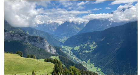
Markus Schlupe, Berner Wanderwege