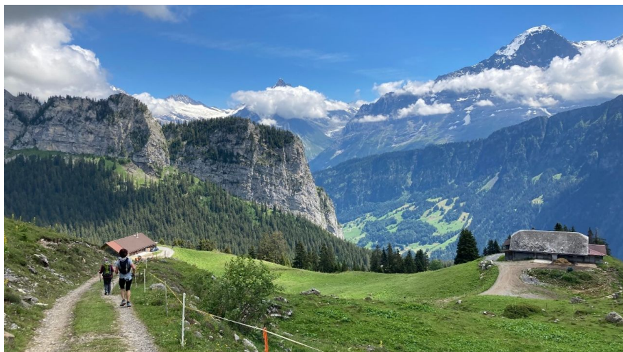
Markus Schlupep, Berner Wanderwege