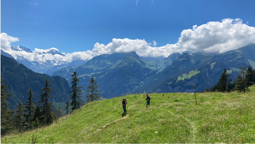
Markus Schlupe, Berner Wanderwege