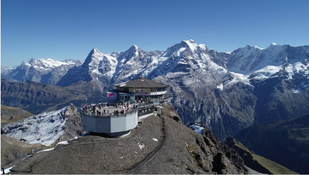
Schilthorn - Piz Gloria