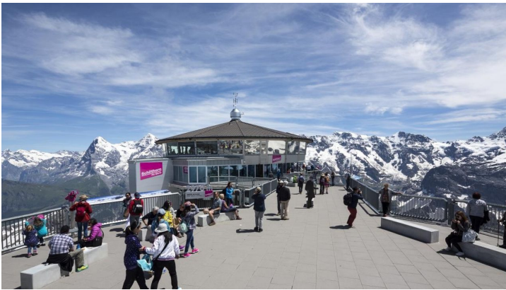
Schilthorn - Piz Gloria - © Schilthornbahn AG, Schilthornbahn AG