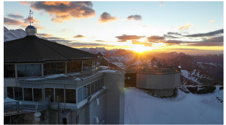
Schilthorn - Piz Gloria