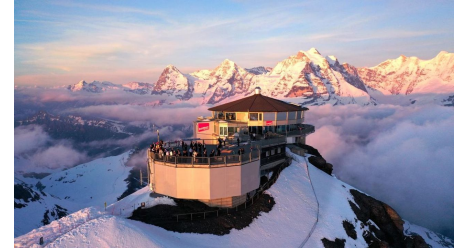
Schilthorn - Piz Gloria - © Schilthornbahn AG, Schilthornbahn AG