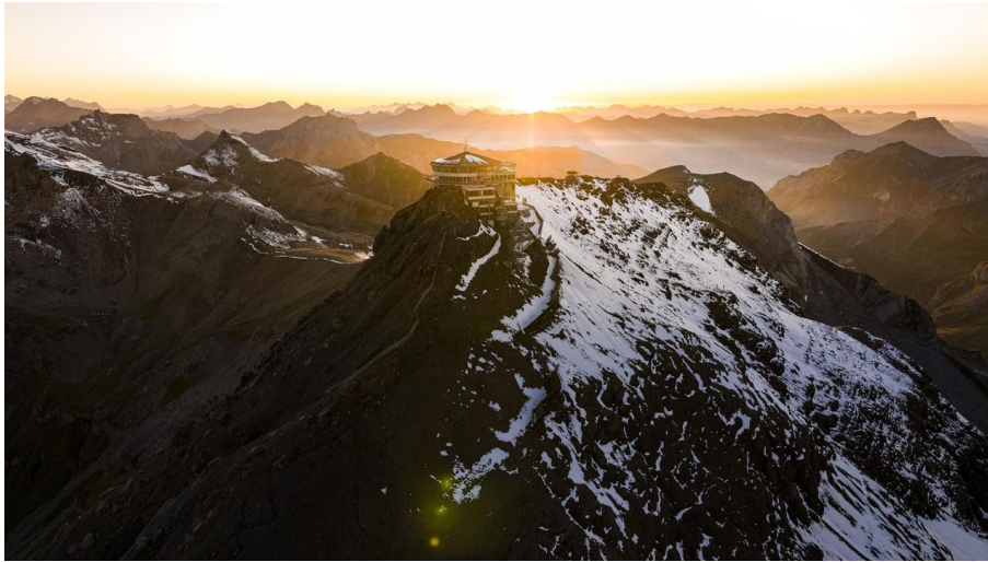
Schilthorn - Piz Gloria - © Schilthornbahn AG, Schilthornbahn AG