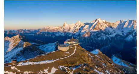
Schilthorn - Piz Gloria