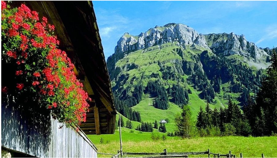
Berner Wanderwege, Berner Wanderwege