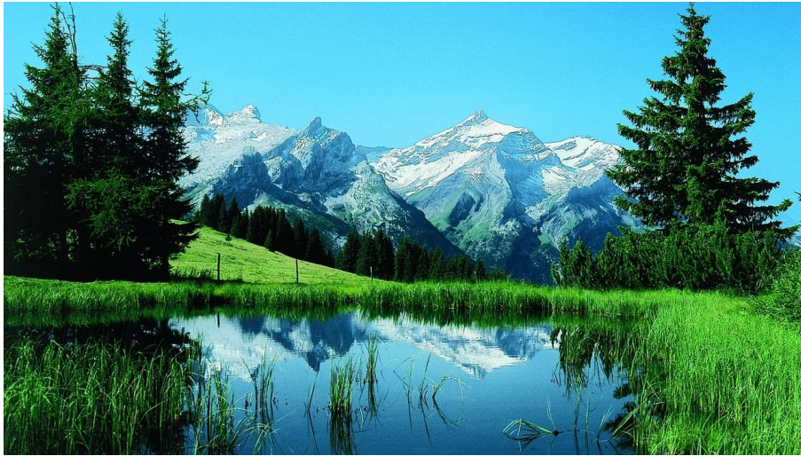
Berner Wanderwege, Berner Wanderwege