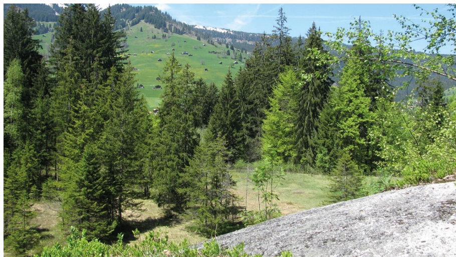
Berner Wanderwege, Berner Wanderwege