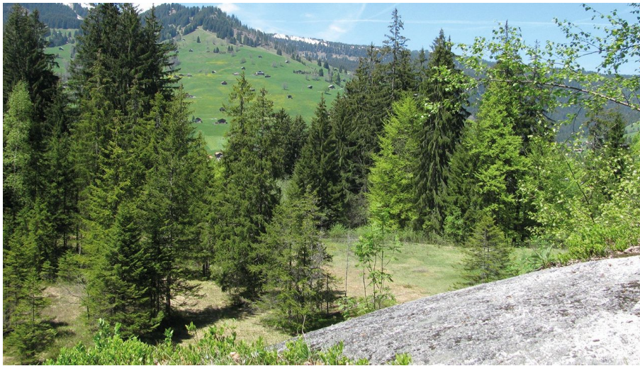
Berner Wanderwege, Berner Wanderwege