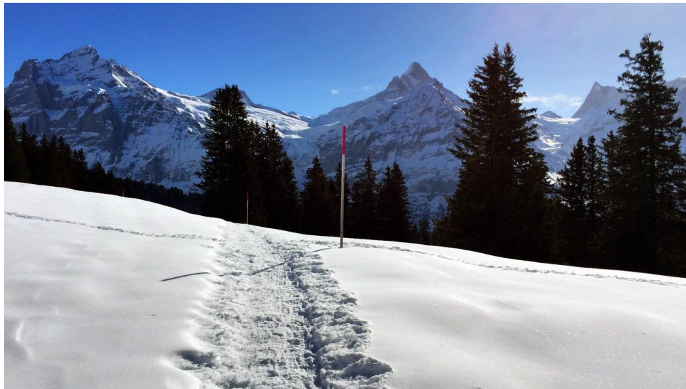
Sehr schöner Teil vom Trail!