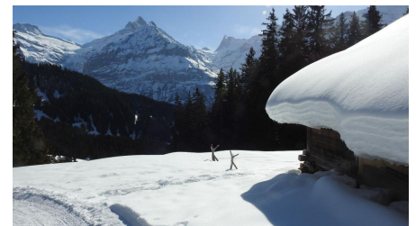
Die "hohen Hörner": Schreck- Lauteraar- Finsteraarhorn