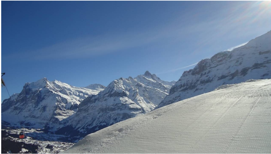
Eiger Trail