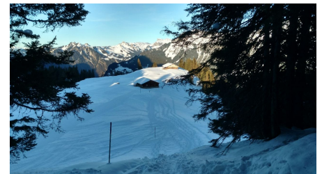
Beat Flückiger, Berner Wanderwege