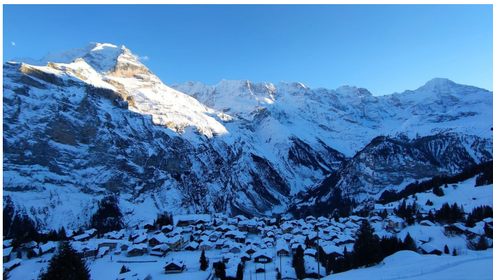
Beat Flückiger, Berner Wanderwege