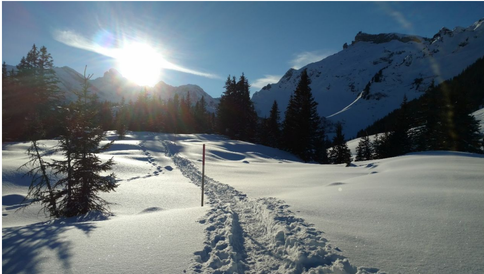
Beat Flückiger, Berner Wanderwege