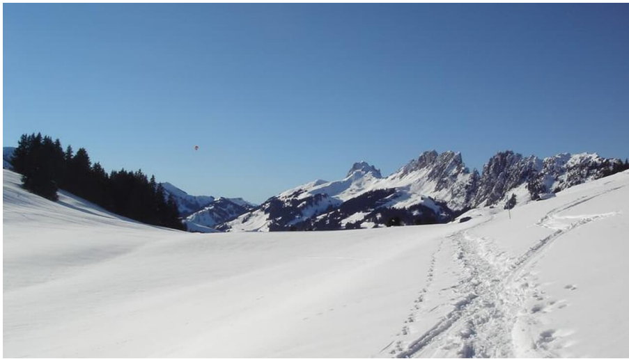
Jaunpass Trail