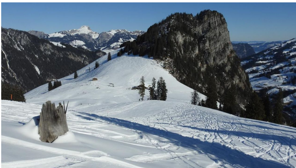
Auf halber Höhe mit Blick auf das Stockhorn und gegen das Mittelland