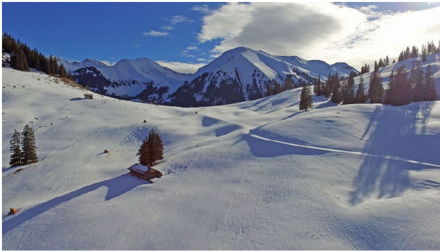
diemtigtal.ch, Berner Wanderwege