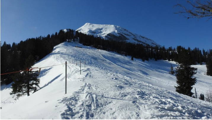
Am Rand der Piste rauf zur Endstation mit Wirihoire dahinter