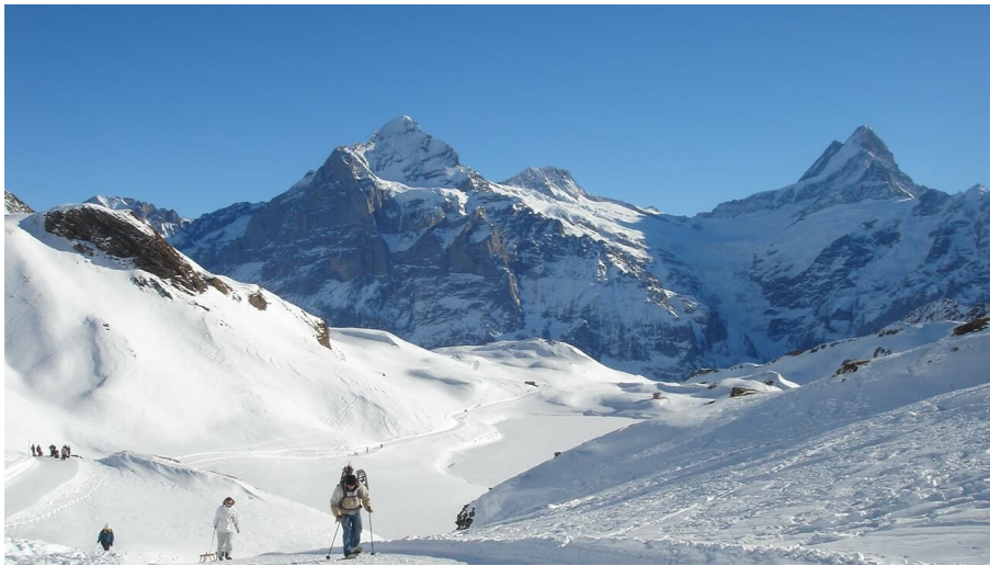
Markus Schlupe, Berner Wanderwege