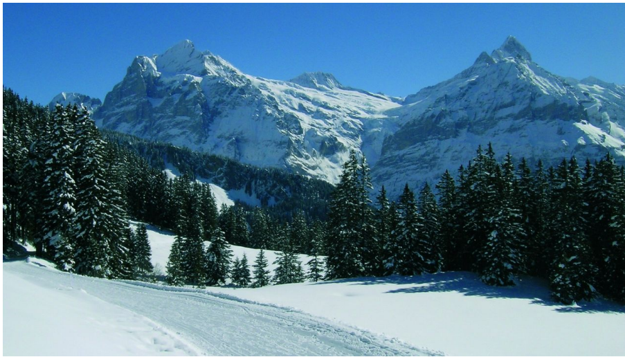
Berner Wanderwege, Berner Wanderwege