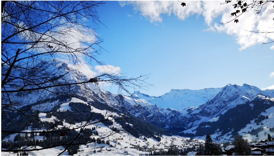
Adelboden Tourismus, Unbekannt