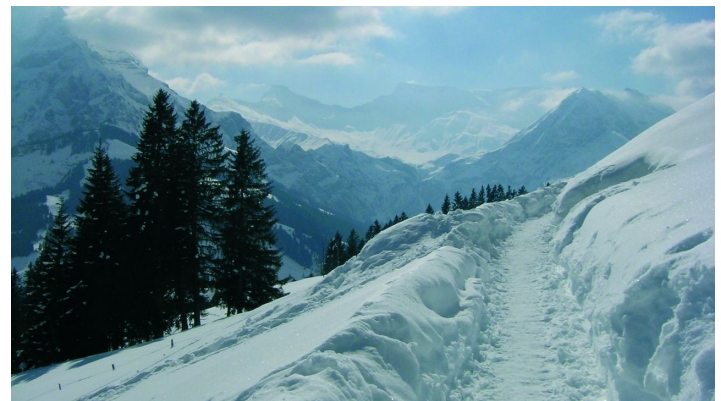
Berner Wanderwege, Berner Wanderwege