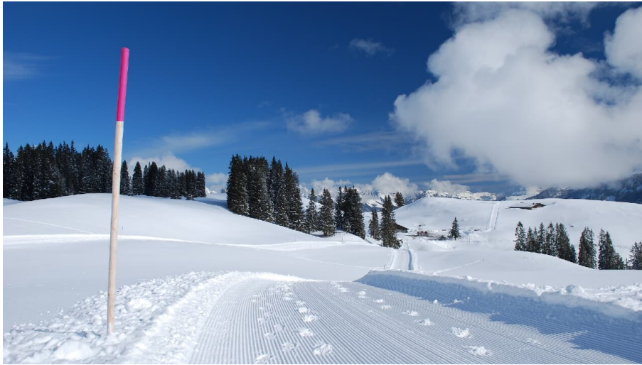
Markus Schlupe, Berner Wanderwege