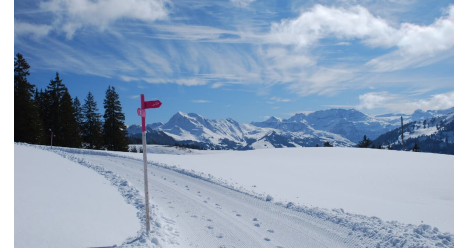
Markus Schluop, Berner Wanderwege