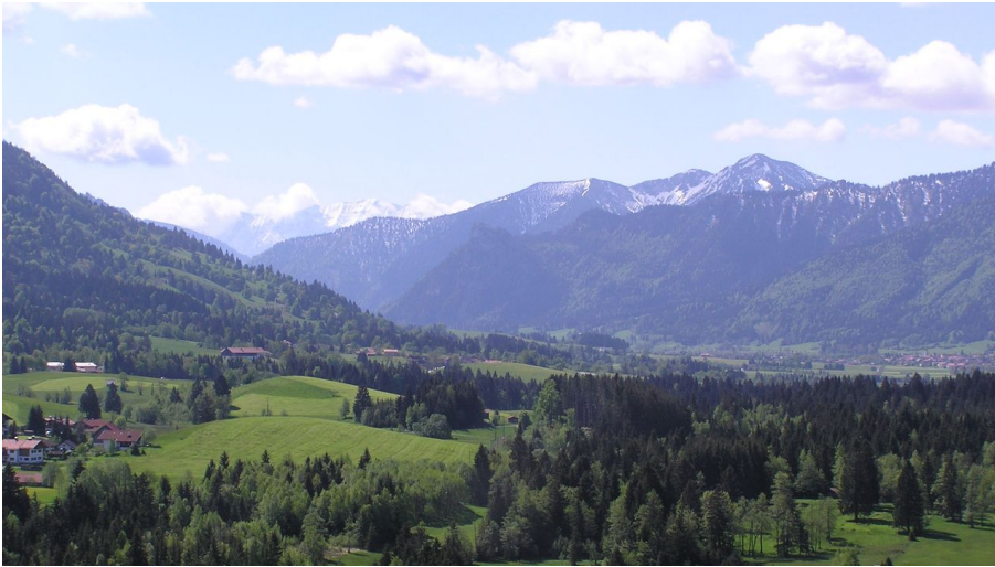
Radtour Kammerlrunde - Blick auf die Ammergauer Alpen