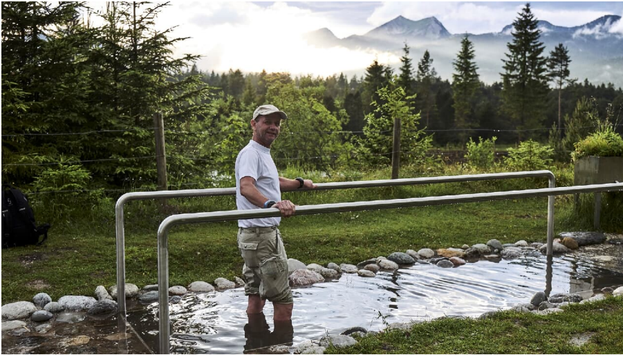
Isar-Natur-Erlebnisweg in Krün im Kneippbecken