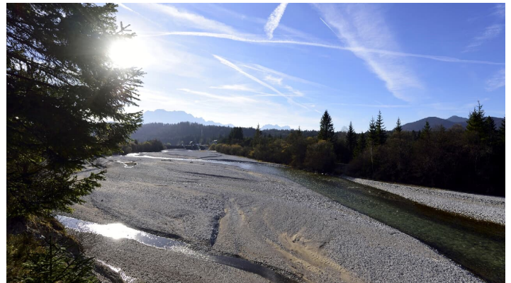
Das Isarflussbett bei Krün