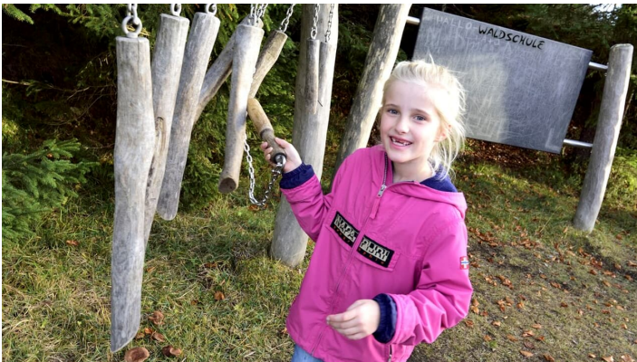
Auf dem Isar-Natur-Erlebnisweg in Krün