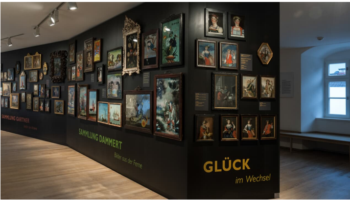
Schloßmuseum Murnau, Alfred Küng