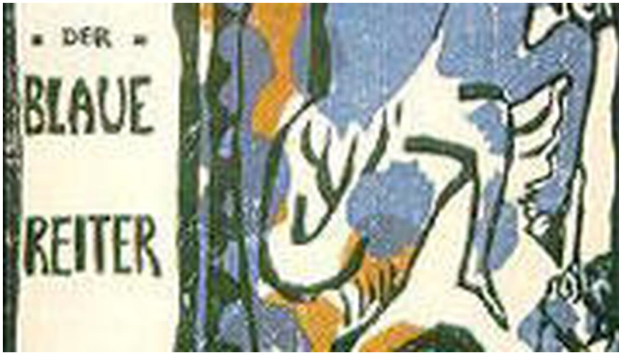
blauer Reiter