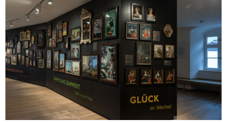
Schloßmuseum Murnau, Alfred Küng