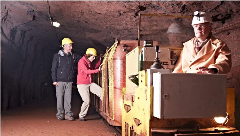
Besucherbergwerk Kleinenbremen Grubenbahn

Einfahrten (=Führungen) jeweils um 11:30 / 13:00 / 14:30 Uhr Bei Schnee- und Eisglätte finden keine Führungen statt.