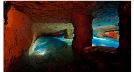
Blaue Lagune im Besucher-Bergwerk Kleinenbremen