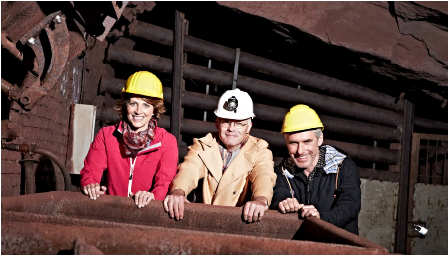
Besucherbergwerk & Museum Kleinenbremen