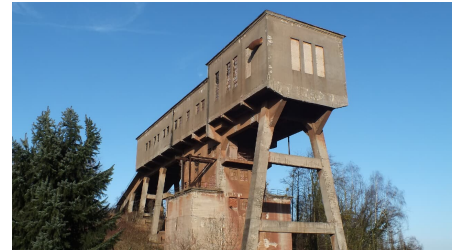
Besucherbergwerk Kleinenbremen Brecherturm