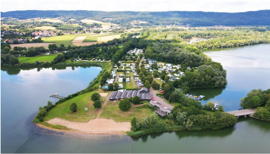
Campingpark Großer Weserbogen in Porta Westfalica - © Touristikzentrum Westliches Weserbergland, Meyer zu Bentrup - Campingpark Grosser Weserbogen