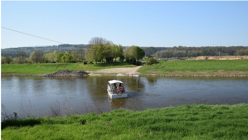
Weserfähre Varenholz-Veltheim Überfahrt

Fährzeiten von April bis Oktober jeweils samstags, sonntags sowie an Feier- und Brückentagen. Kein Fährbetrieb bei Hoch- und Niedrigwasser; bei Gewitter oder Starkregen wird der Fährbetrieb unterbrochen bzw. eingestellt. Auf der Website ist tagesaktuell abrufbar, ob die Fähre in Betrieb ist. Bitte dort informieren, bevor Sie sich auf den Weg zur Fähre machen. Für Gruppen ab 10 Personen: Wochentags auf Anmeldung bei der Gemeinde Kalletal (mind. 3 Tage vorher), Tel.: 05264 / 644 -113.