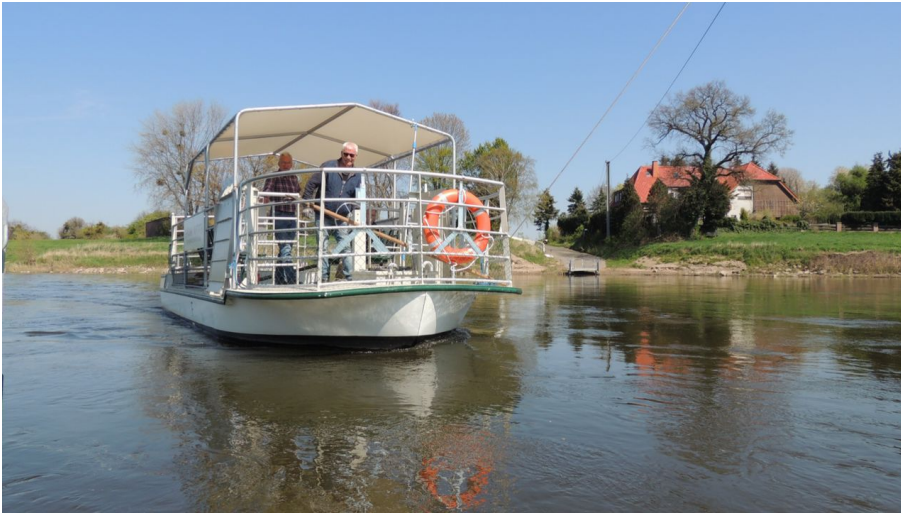
Weserfähre Veltheim-Varenholz