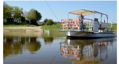
Hochseilfähre Varenholz-Veltheim