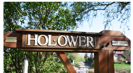
Weserfähre Varenholz-Veltheim "Hol über" - © Touristikzentrum Westliches Weserbergland, Gemeinde Kalletal