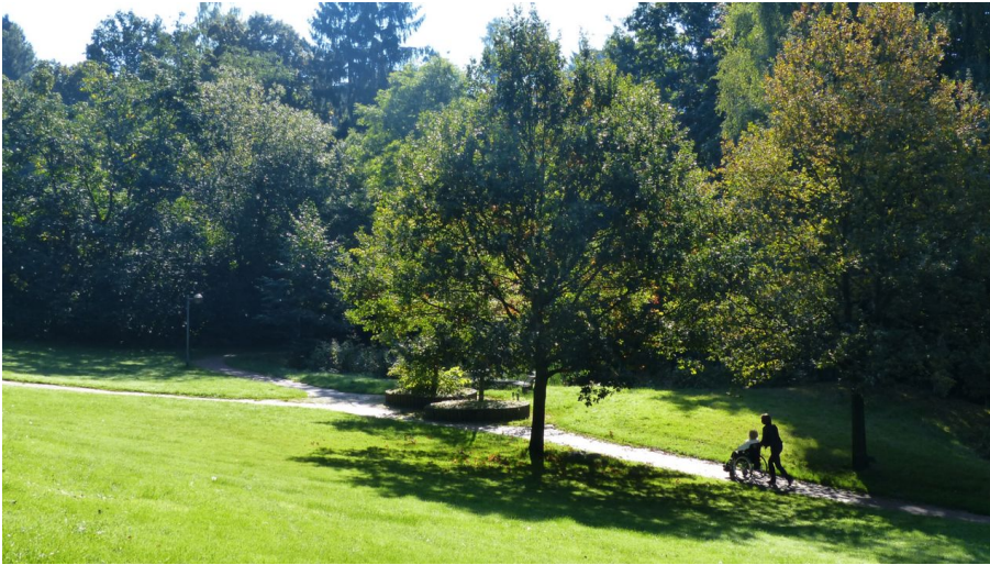
Kurpark Porta Westfalica