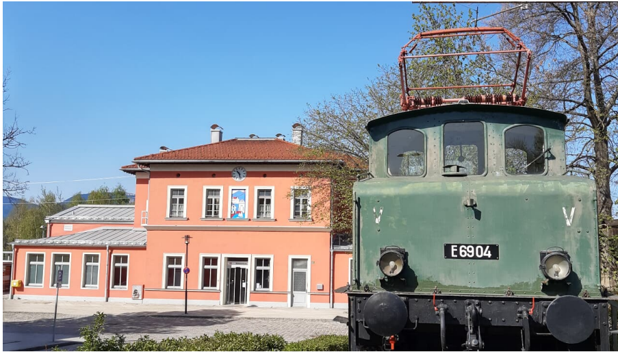
Bahnhof @Carolina Hopen (2).jpg