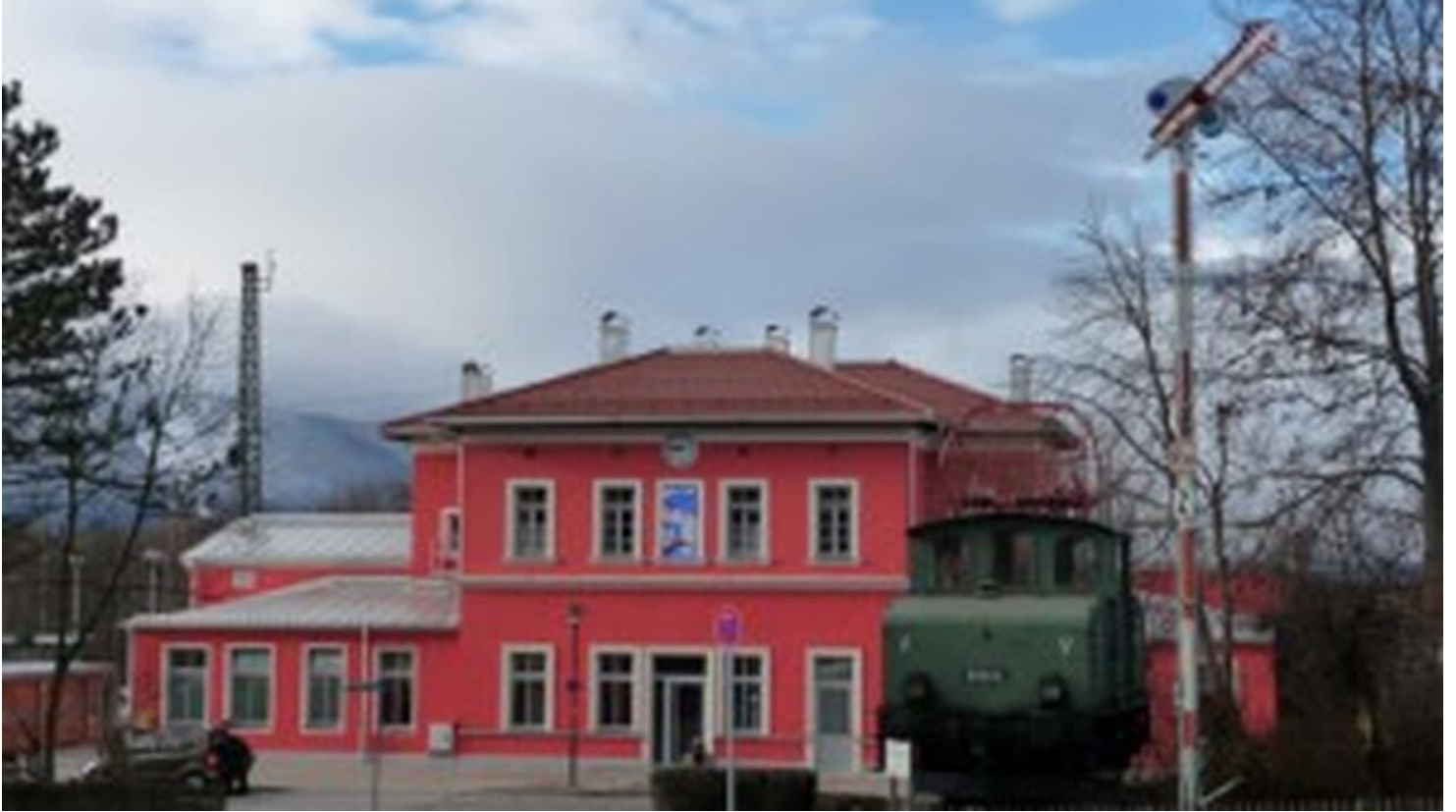
Bürgerbahnhof Murnau