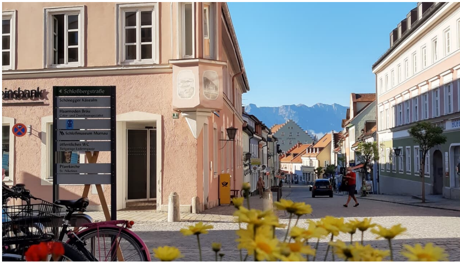
Fußgängerzone morgens @Carolina Hopfen.jpg