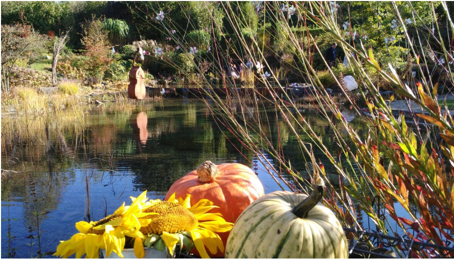
Herbst im Gartenwerk Dukat - © Andrea Thiessen