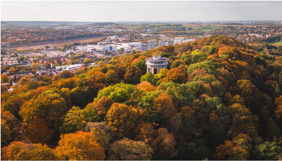
Lousberg Aachen im Herbst - © Niklas Birk