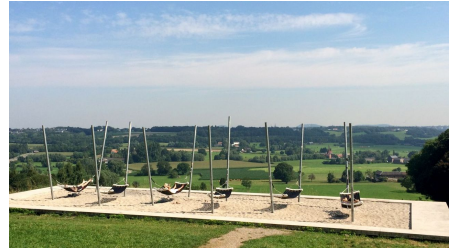
Lousberg Hängematten