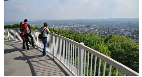
Lousberg Aussichtsplattform