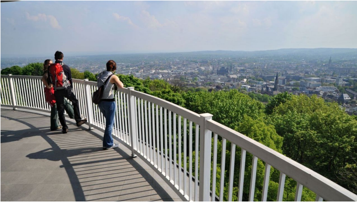
Lousberg Aussichtsplattform