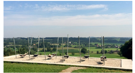
Lousberg Hängmatten