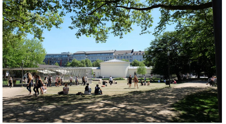
Eisengarten Aachen