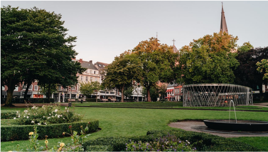
Elisengarten Aachen mit Archäologischer Vitrine