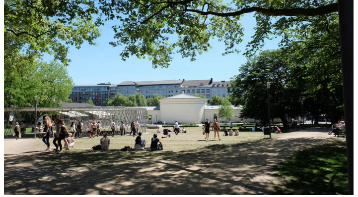
Eisengarten Aachen