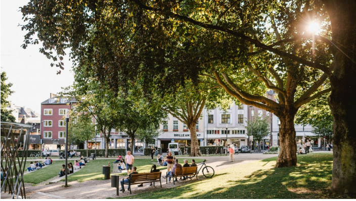
Eisengarten Aachen mit Sonne