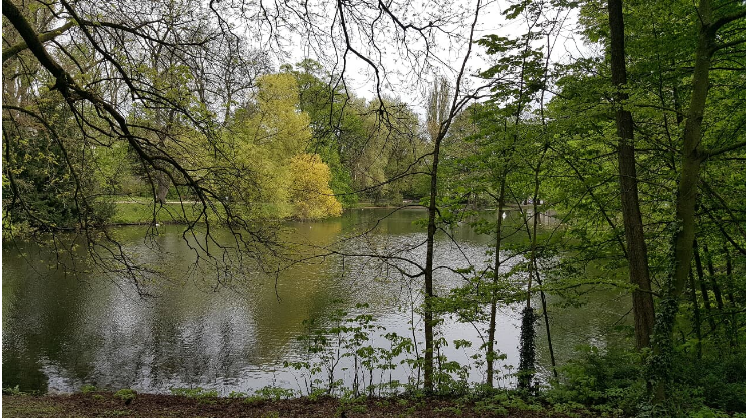
2017-04 Westpark (c) ats (1).jpg - © aachen tourist service e.v.