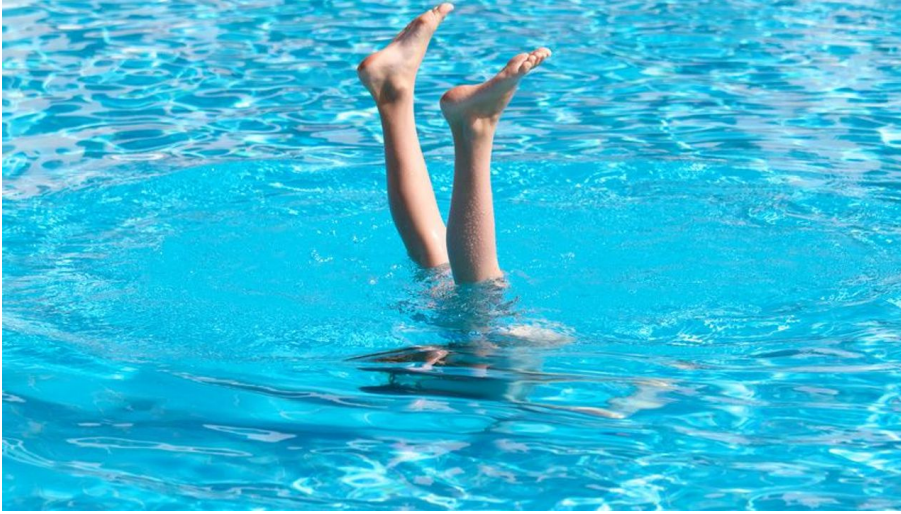
Freibad Hangeweiher - © f2.8 by ARC / fotolia.com