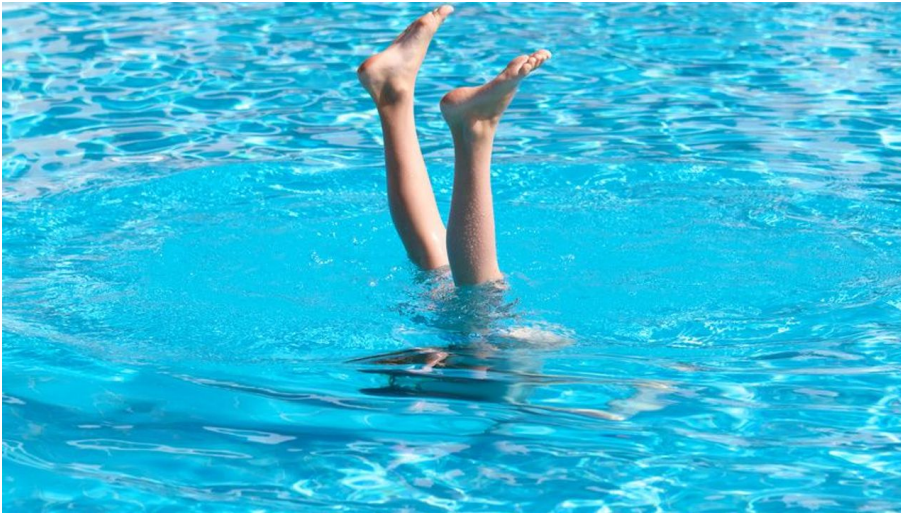
Freibad Hangeweiher - © f2.8 by ARC / fotolia.com