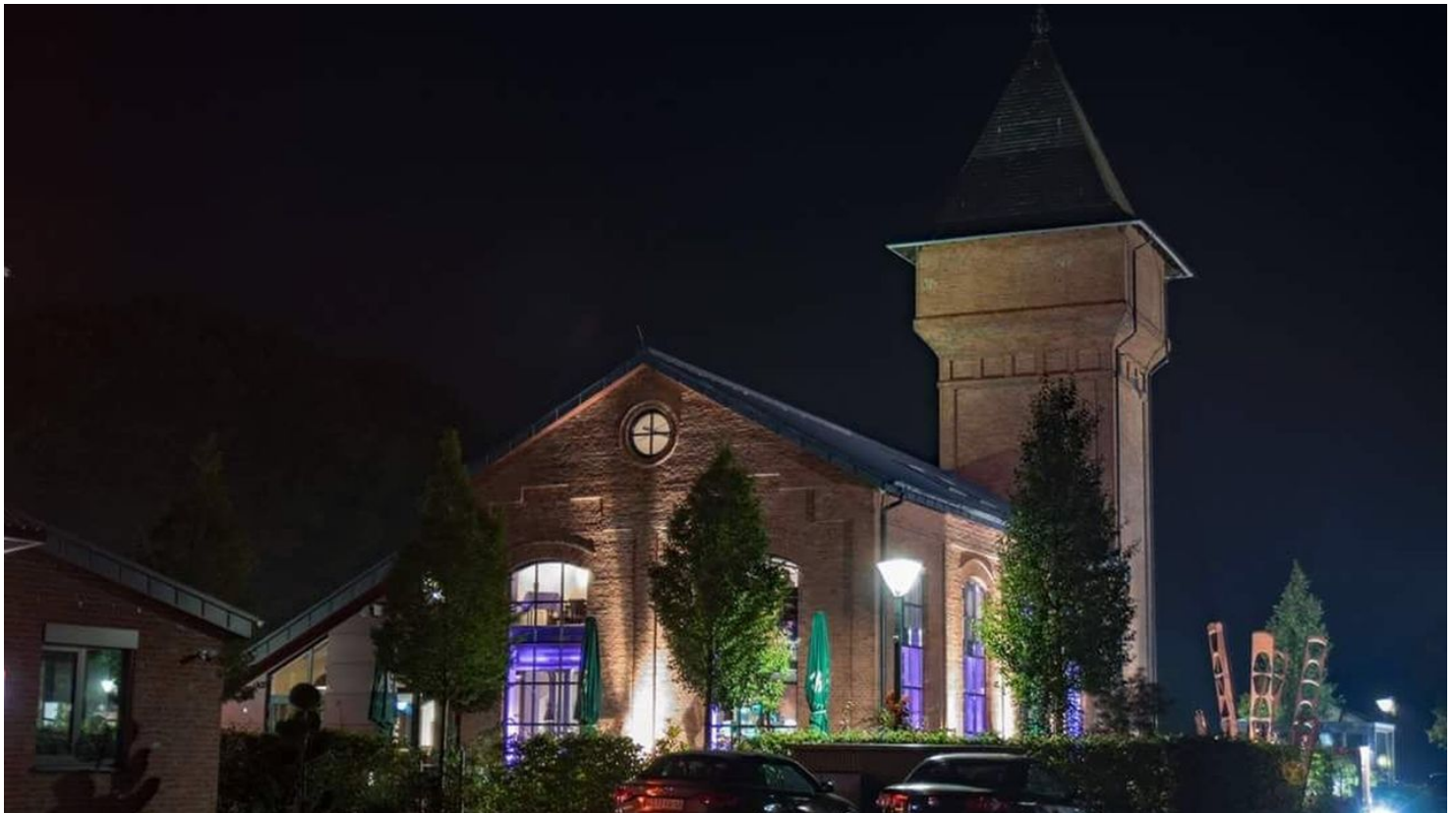
Eisenhütte bei Nacht