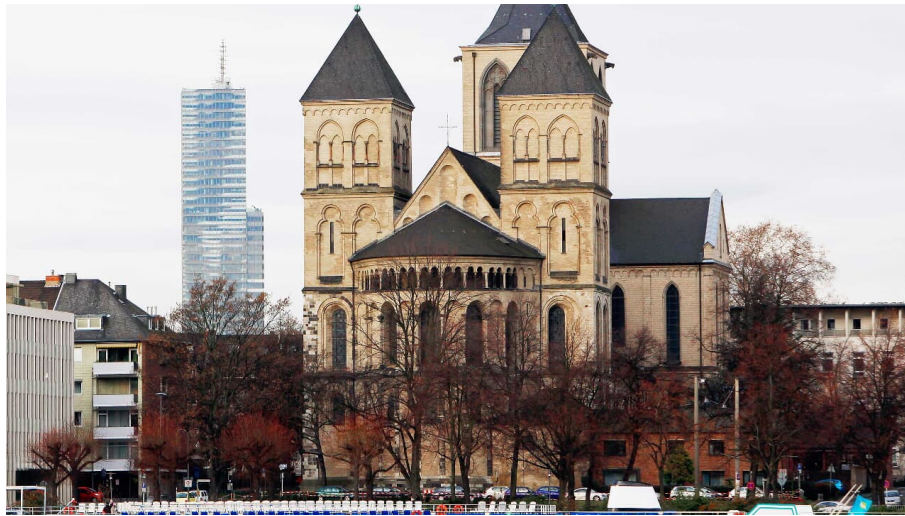
Romanische Kirche St. Kunibert_udo_haake