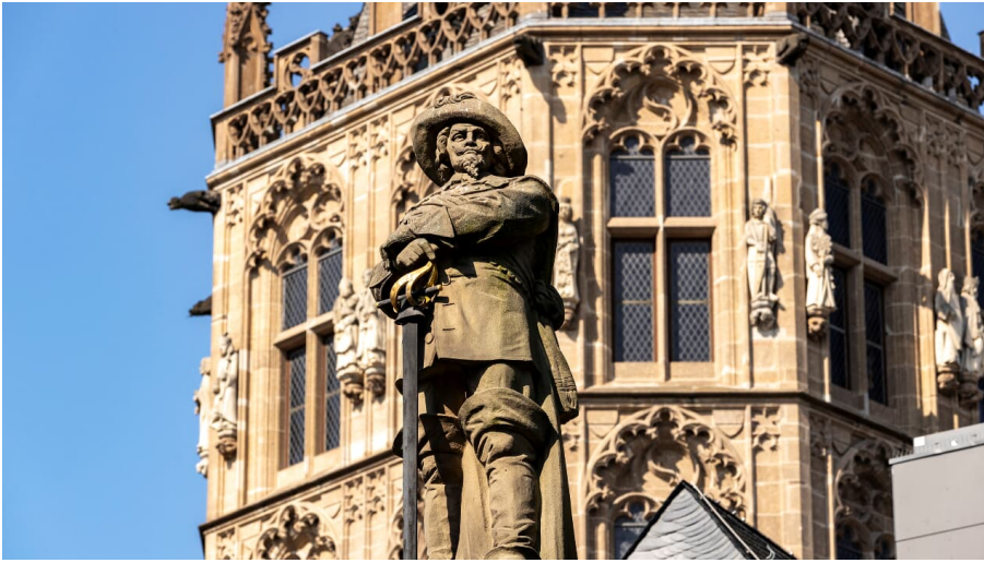
Jan-von-Werth-Denkmal-KoelnTourismus-Seelbach_1988.jpg - © KölnTourismus, Foto: Christoph Seelbach