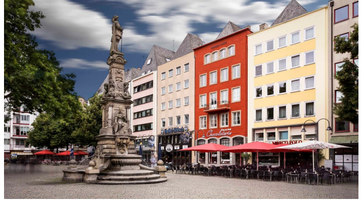
koelner-altstadt-alter-markt-jens-korte-koelntourismus-gmbh - © Jens Korte, KölnTourismus GmbH