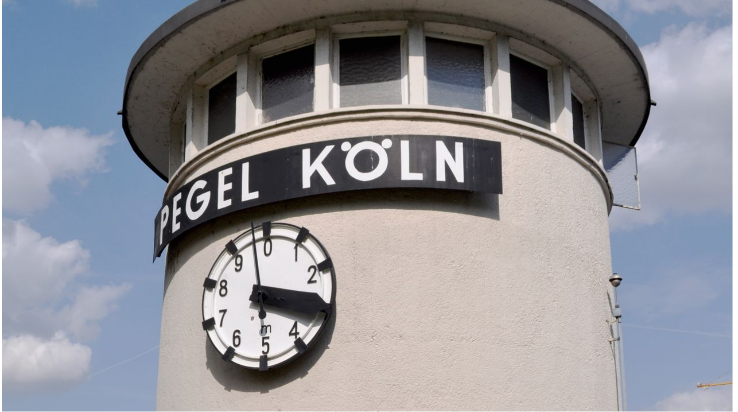
pegel-koeln-sandra-schweer - © Sandra Schweer