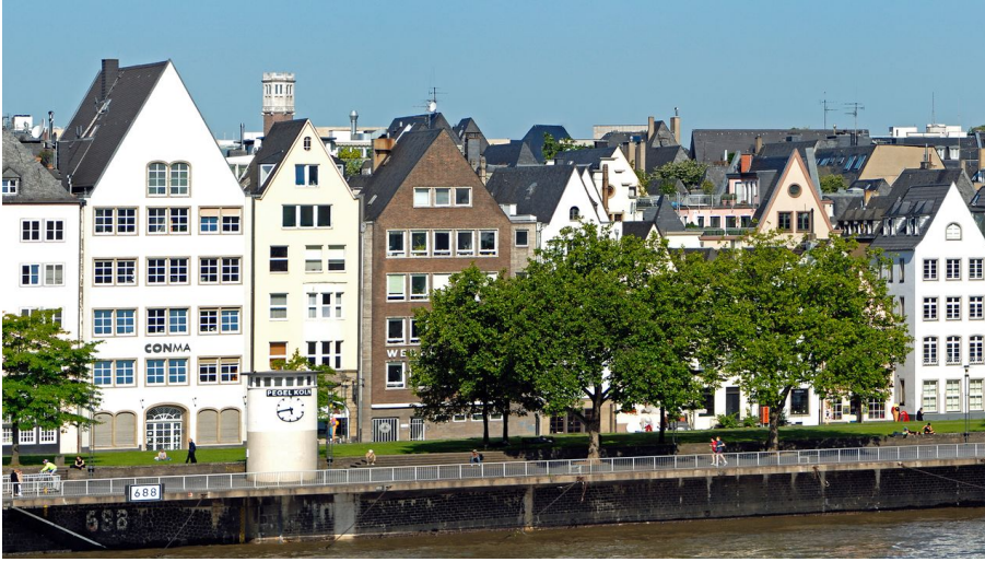
koelner-rheinpanorama-koelntourismus-gmbh-udo-haake - © KölnTourismus GmbH, Udo Haake