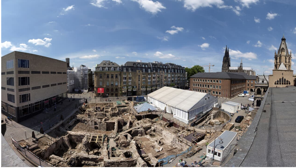
archaeologische-zone-christina-kohnen - © Christina Kohnen