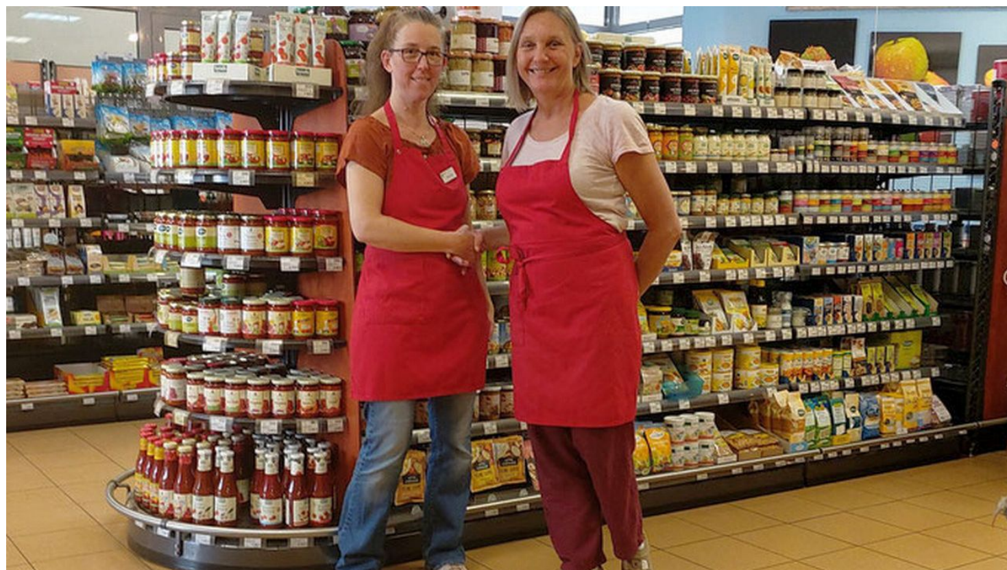
Ährensache Bad Aibling