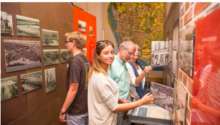
Familie im Küstenmuseum_Stöver