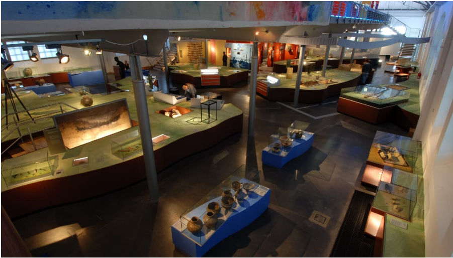
Ausstellung Küstenmuseum_Schreiber