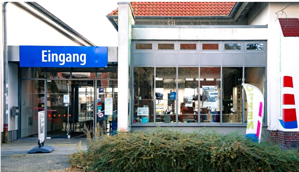
Eingang Küstenmuseum_Ganske

Samstag, 16.12.2023, 11:00 - 17:00 Uhr Sonntag, 17.12.2023, 11:00 - 17:00 Uhr Dienstag, 19.12.2023, 11:00 - 17:00 Uhr Mittwoch, 20.12.2023, 11:00 - 17:00 Uhr Donnerstag, 21.12.2023, 11:00 - 17:00 Uhr Freitag, 22.12.2023, 11:00 - 17:00 Uhr Samstag, 23.12.2023, 11:00 - 17:00 Uhr Mittwoch, 27.12.2023, 11:00 - 17:00 Uhr Donnerstag, 28.12.2023, 11:00 - 17:00 Uhr Freitag, 29.12.2023, 11:00 - 17:00 Uhr Samstag, 30.12.2023, 11:00 - 17:00 Uhr [...]