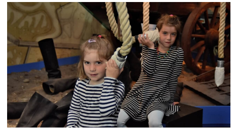
Mädchen im Küstenmuseum Wilhelmshaven - © Foto: Dietmar Bökhäus