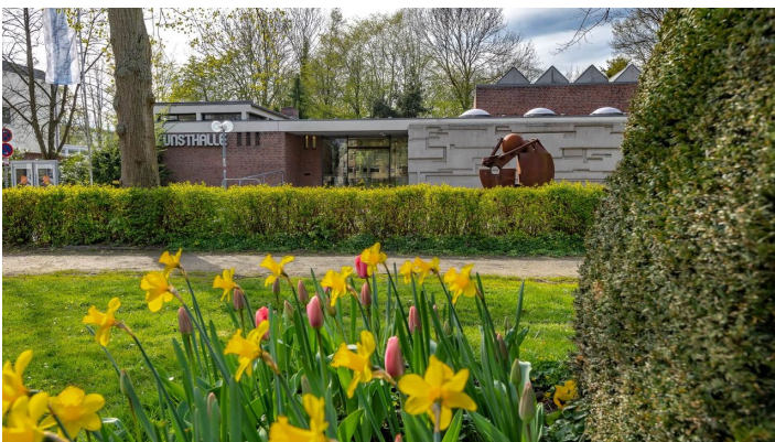
Blick auf die Kunsthalle Wilhelmshaven

Während Umbauphasen bleibt die Kunsthalle geschlossen.