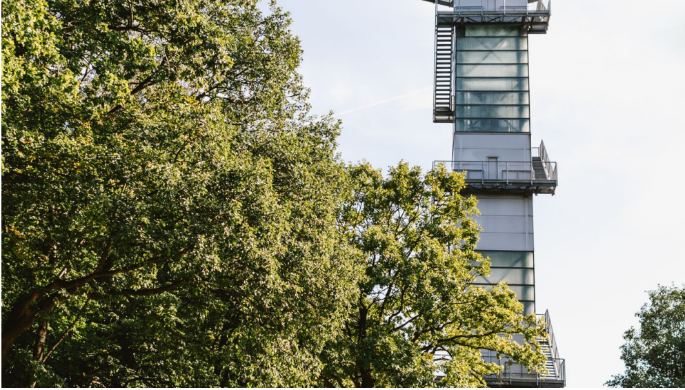
Dreiländereck Aussichtsturm.jpg