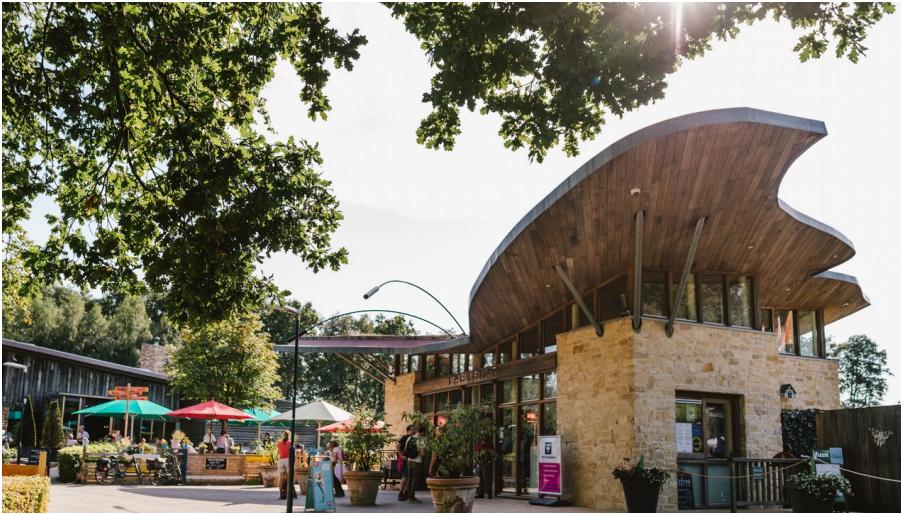
Dreiländereck Labyrinth.jpg