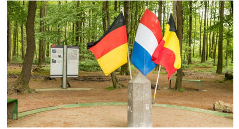
Dreiländereck - © D. Ketz / StädteRegion Aachen