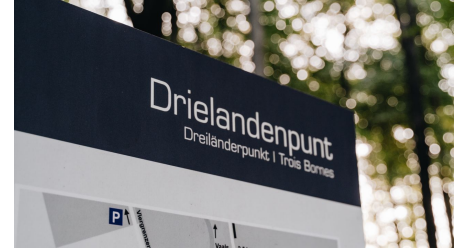
Dreiländerpunkt Ausschnitt.jpg