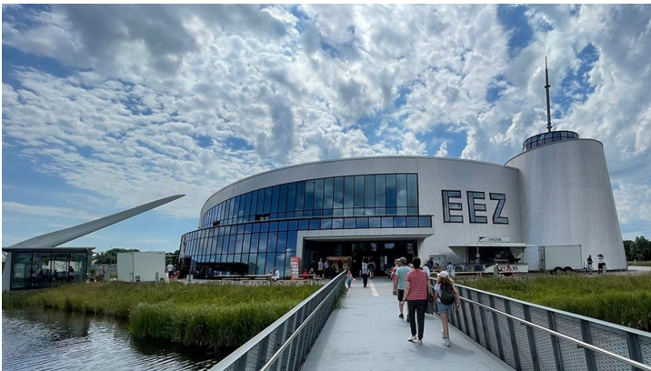
ENERIE ERLEBIS ZENTRUM Ostfriesland