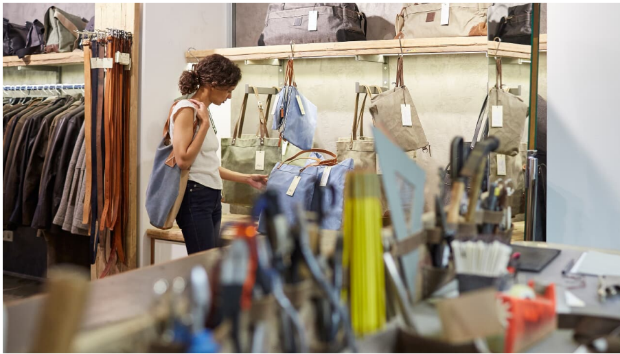
Shopping bei 'Hack Lederware' in Köln