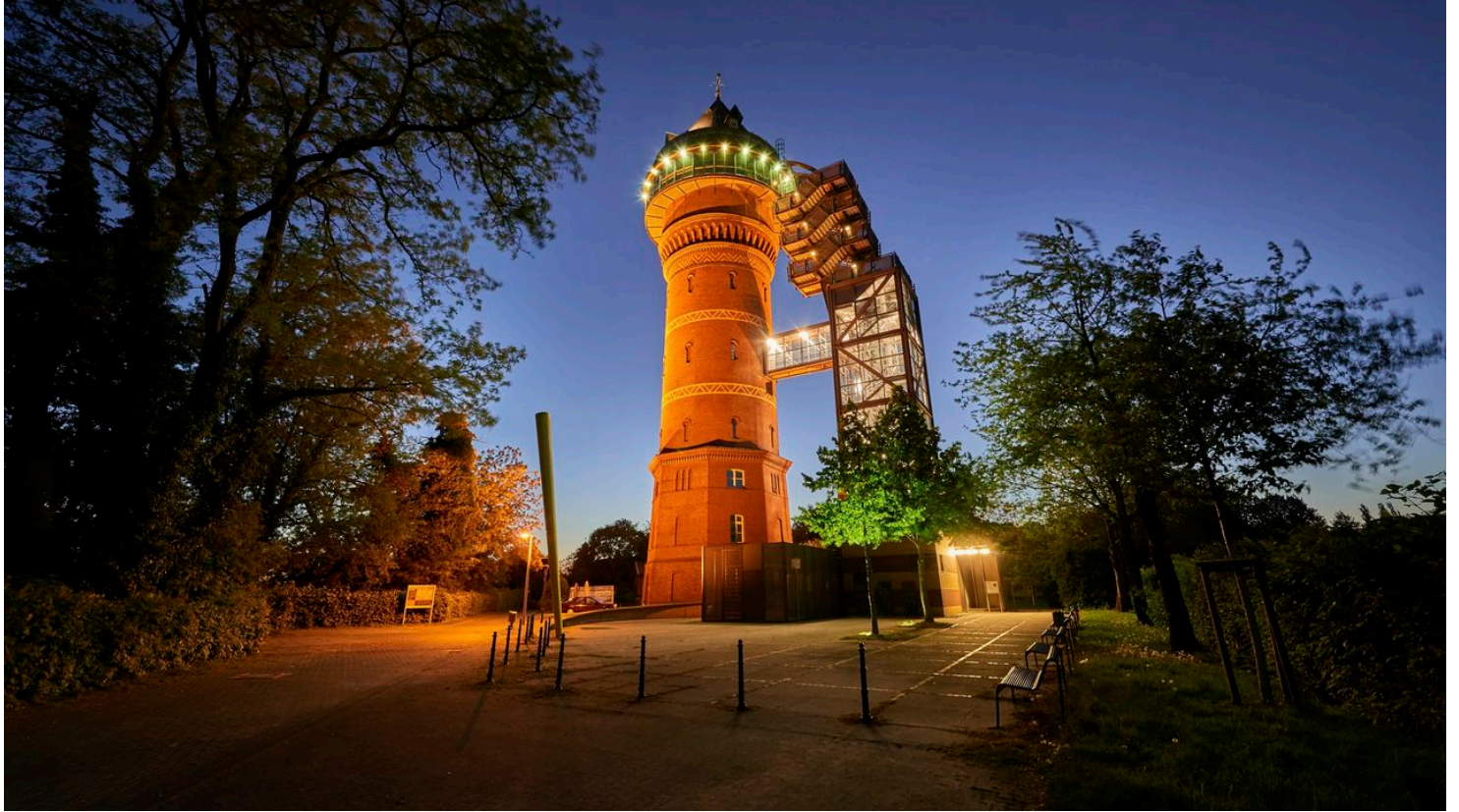
Aquarius Wassermuseum