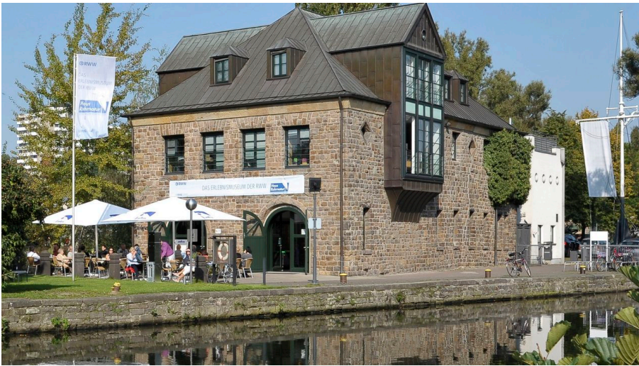
Haus Ruhrnatur