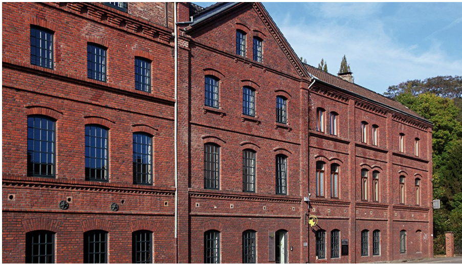
Leder und Gerbermuseum