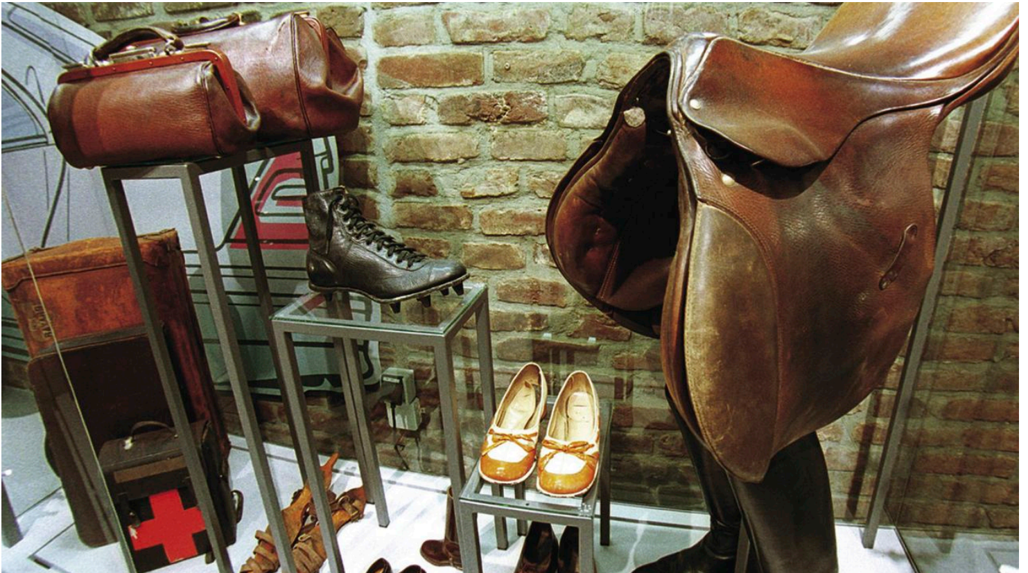
Leder- und Gerbermuseum

Mittwoch bis Sonntag von 14.00 bis 18.00 Uhr