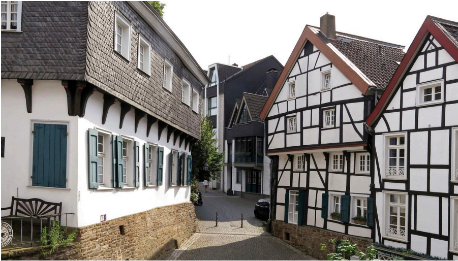
Heimatmuseum Tersteegenhaus - © Markus Krieger