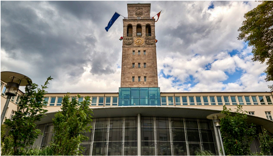
Historisches Rathaus