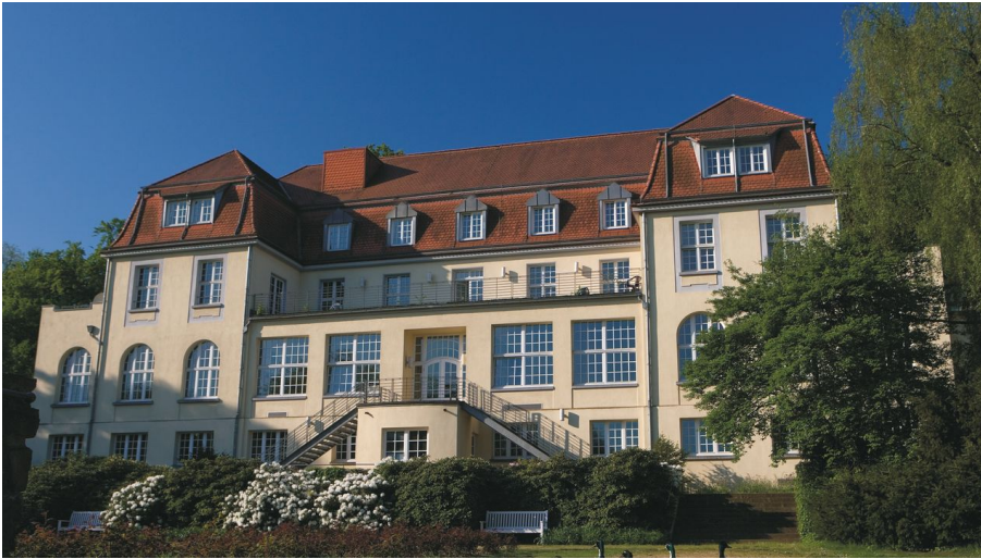
Theater an der Ruhr