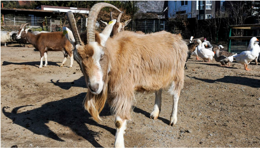
Arche-Park im Witthausbusch