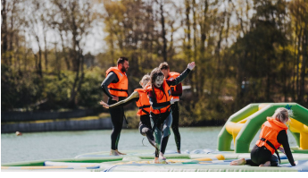
Beachclub Nethen - Aquapark