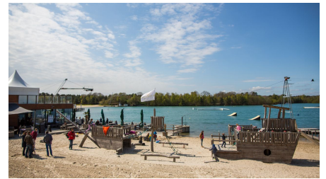
Beachclub Nethen - Spielplatz