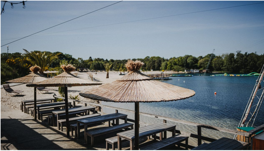
21-07-06 Beachclub Nethen.jpg