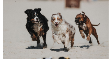
Beachclub Nethen - Hundestrand - © www.fotoduda.de