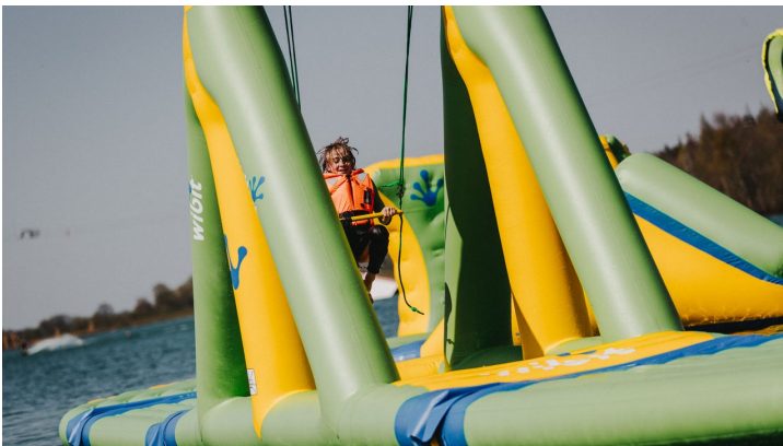
Beachclub Nethen - Aquapark - © www.fotoduda.de