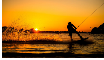
Beachclub Nethen - Wakeboard