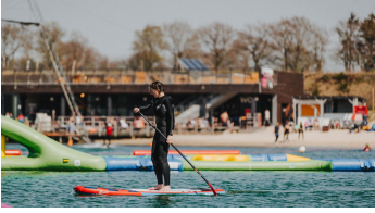
Beachclub Nethen - SUP - © www.fotoduda.de