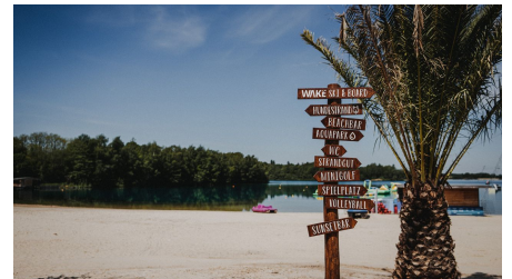
21-07-06 Beachclub Nethen2.jpg