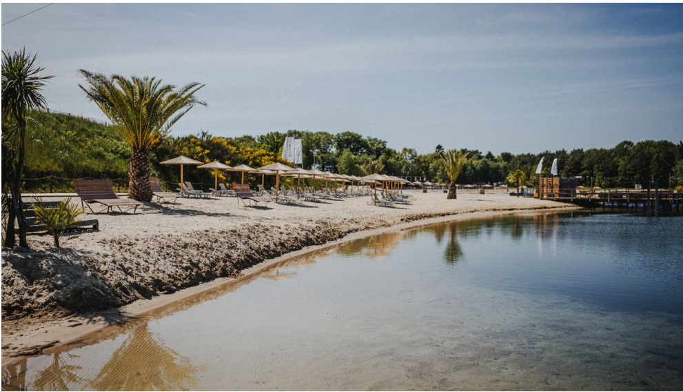
21-07-06 Beachclub Nethen1.jpg

Aus aktuellem Anlass ist der Betrieb bis auf weiteres eingestellt. Bei schönem Wetter können sich die Öffnungszeiten kurzfristig ändern - aktuell auf beachclub_nethen. (Instagram) oder BCNETHEN (Facebook) Der Wasserskilift läuft bei jedem Wetter, ausser bei Gewitter oder Frost. Der Aquapark ist bei Dauerregen nicht geöffnet. TAG STRAND LIFT AQUAPARK Montag 12:00-21:30 15:00-21:3 14:00-19:00 Dienstag 12:00-21:30 15:00-21:30 14:00-19:00 Mittwoch 12:00-21:30 15:00-21:30 14:00-19:00 Donnerstag 12:00-21:30 15:00-21:30 14:00-19:00 Freitag 12:00-22:00 14:00-21:30 14:00-20:00 Samstag 10:00-22:00 12:00-21:30 12:00-20:00 Sonntag 10:00-21:00 12:00-21:30 12:00-19:00