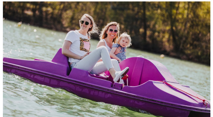
Beachclub Nethen - Tretboot