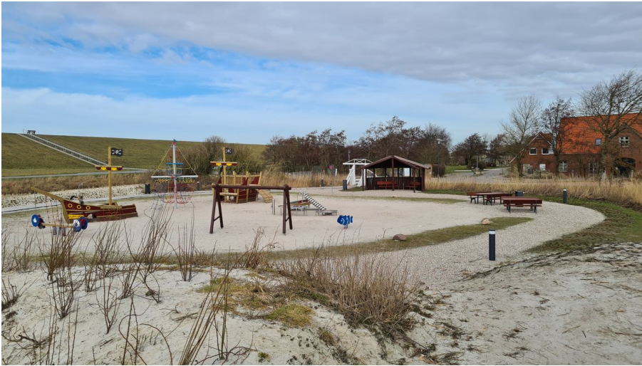
Trockenstrand Upleward Spielplatz.jpg