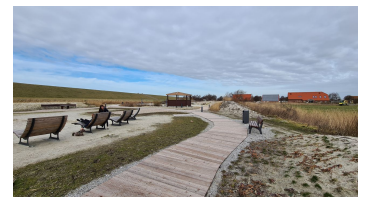
Trockenstrand Upleward Waldsofas.jpg