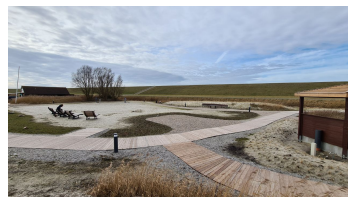
Trockenstrand Upleward Sandfläche.jpg