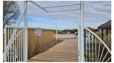
Trockenstrand Upleward Brücke.jpg