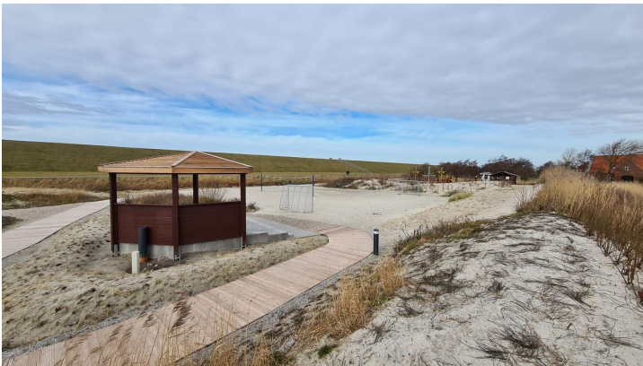
Trockenstrand Upleward Düne.jpg