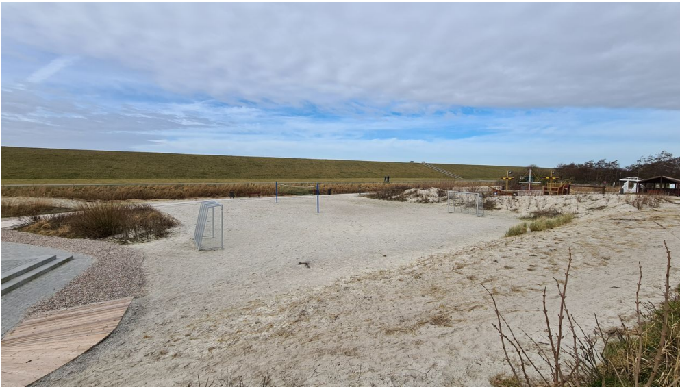
Trockenstrand Upleward Beachsoccerfeld.jpg