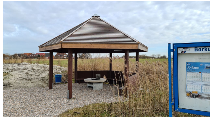
Trockenstrand Upleward Grill.jpg