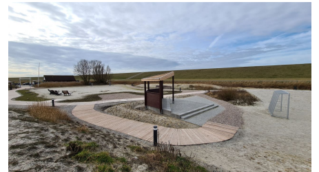
Trockenstrand Upleward Bühne.jpg