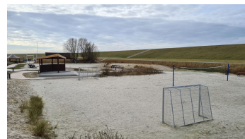
Trockenstrand Upleward Volleyballfeld.jpg