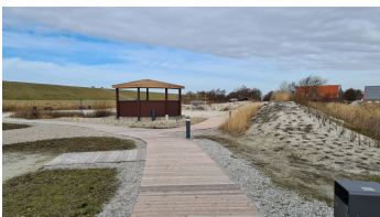
Trockenstrand Upleward Holzbohlenweg.jpg